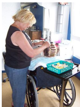
Salon de coiffure