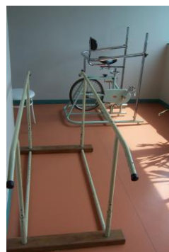
Matériel de rééducation