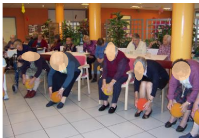
La Gym Douce